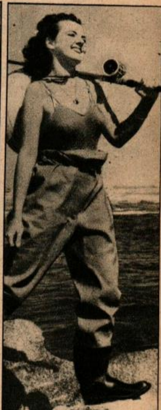
Dans la gravure de gauche on a dû couper un pied et une partie de la raquette. À droite, la même gravure prise après avoir légèrement changé de place l'appareil. Le sujet est mieux présenté, mieux modelé. Le pied et la raquette se trouvent entièrement photographiés. On est cependant resté dans les limites imposées par le format que vous cherchez.