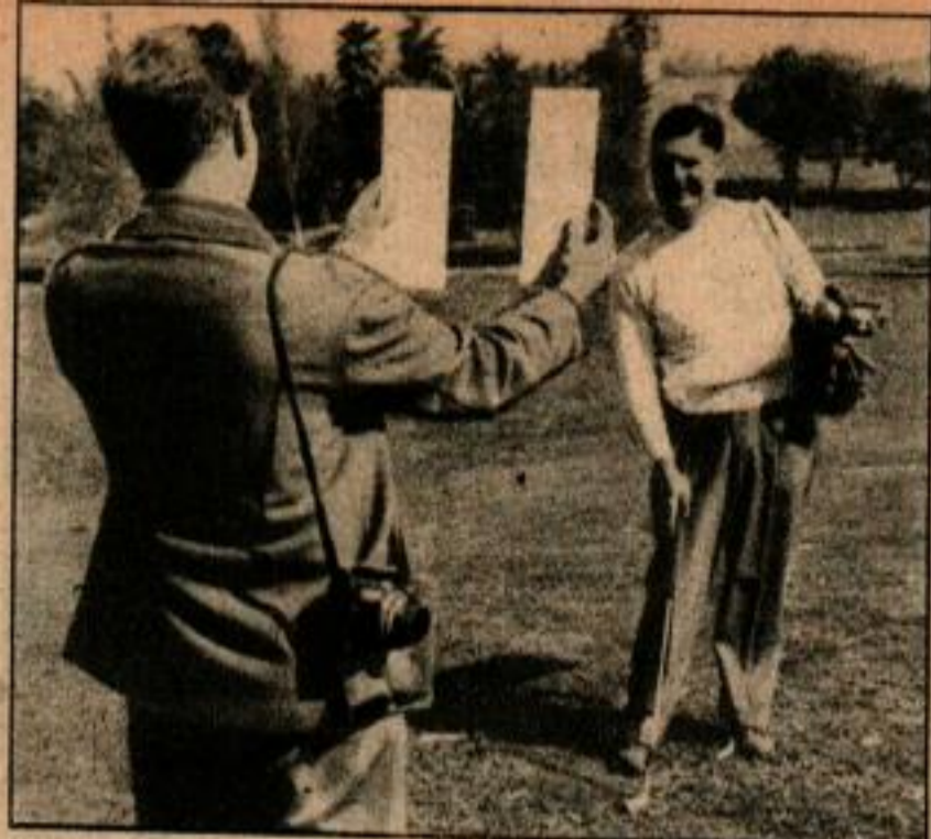
Pour rester dans les limites de la colonne lorsque vous faites une photo, centrez le sujet entre deux masques en carton que vous tenez de la façon indiquée ci-dessus.