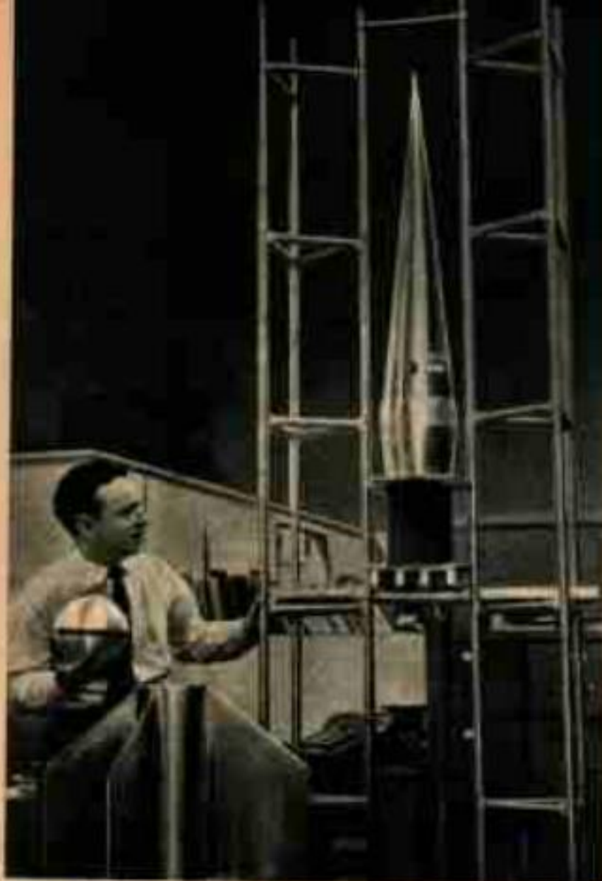
Le nez en forme d'aiguille d'une nouvelle fusée transportera une sphère en aluminium, bourrée d'instruments, jusque dans les couches supérieures de l'atmosphère.