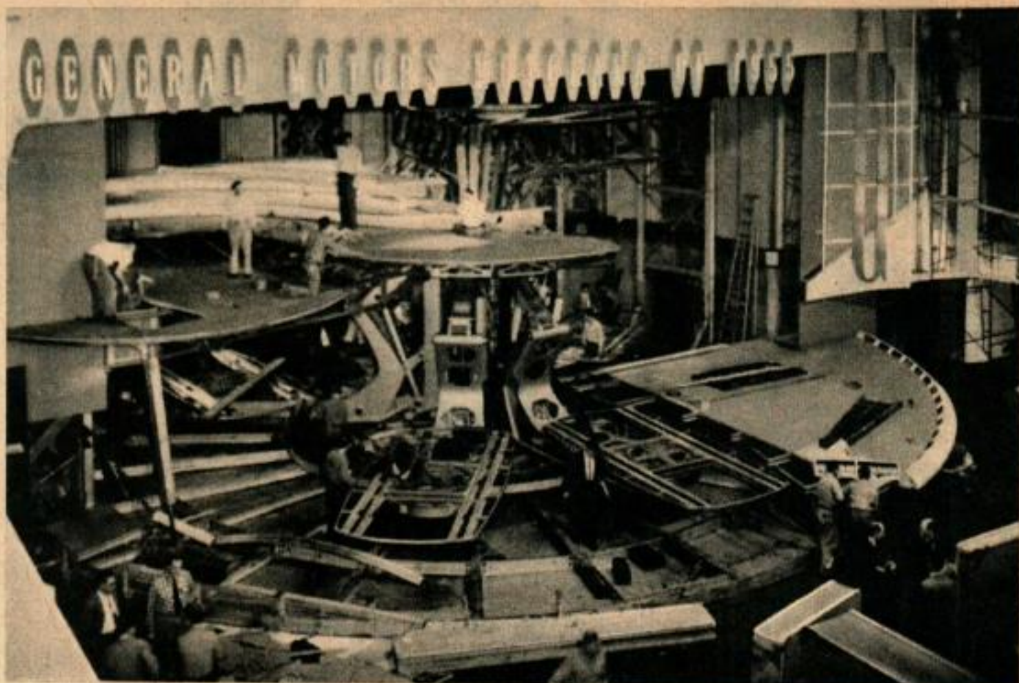
Il faut 48 heures pour monter l'énorme scène. L'ascenseur hydraulique est construit dans le pilier vertical que l'on voit au centre.