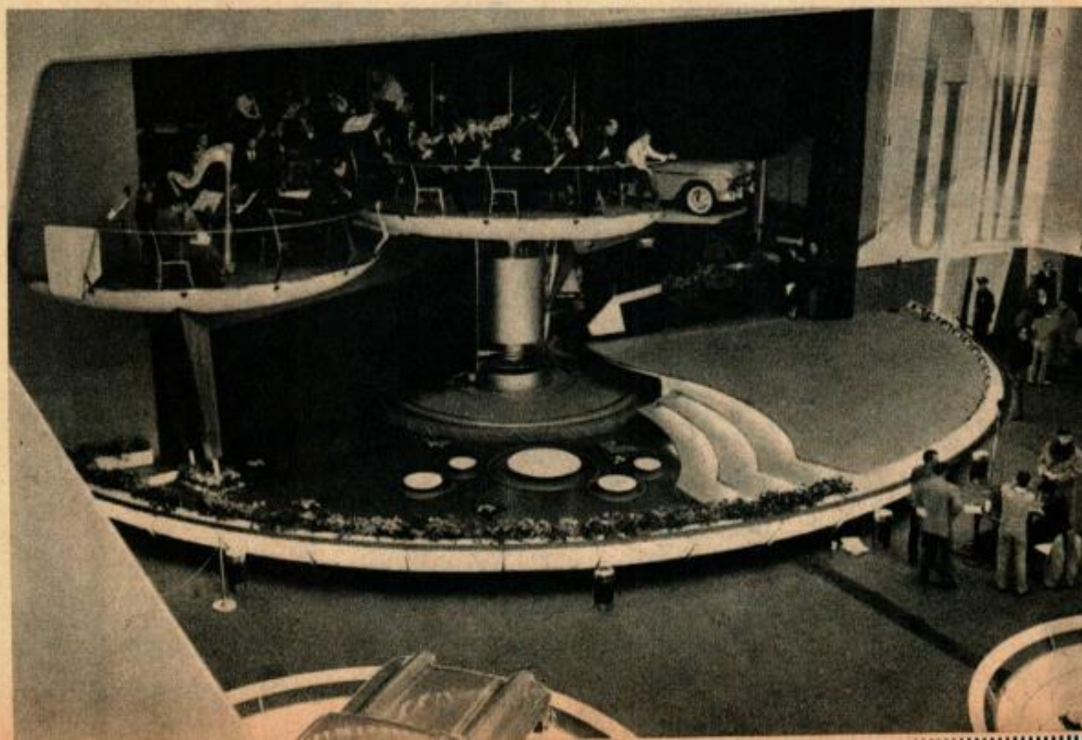
La fosse de l'orchestre est placée au-dessus de la scène. Une Chevrolet 1955 émerge du rideau au début du spectacle.

mobiles de 1 800 kg, les spécialistes de la GM ont construit une scène en forme de soucoupe volante si vaste qu'il faut huit camions pour la transporter de ville en ville, et si complexe qu'il faut 48 heures pour la monter.