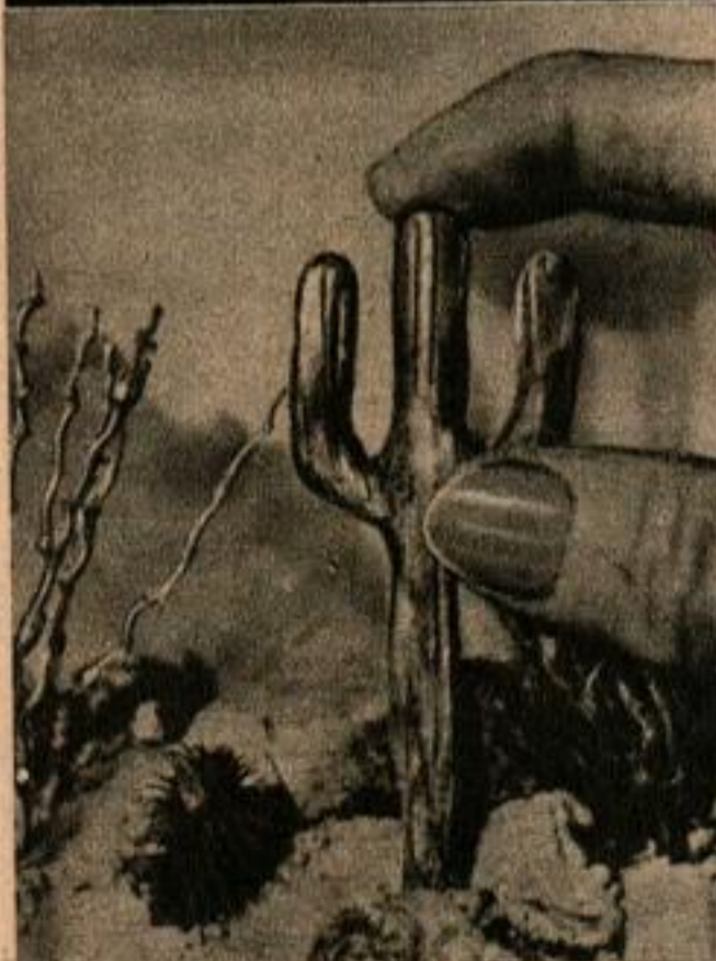
Le cactus d'argile est „ planté ” dans le désert. — A droite, nervures de véritable cactus qui servira à la construction des cadres.