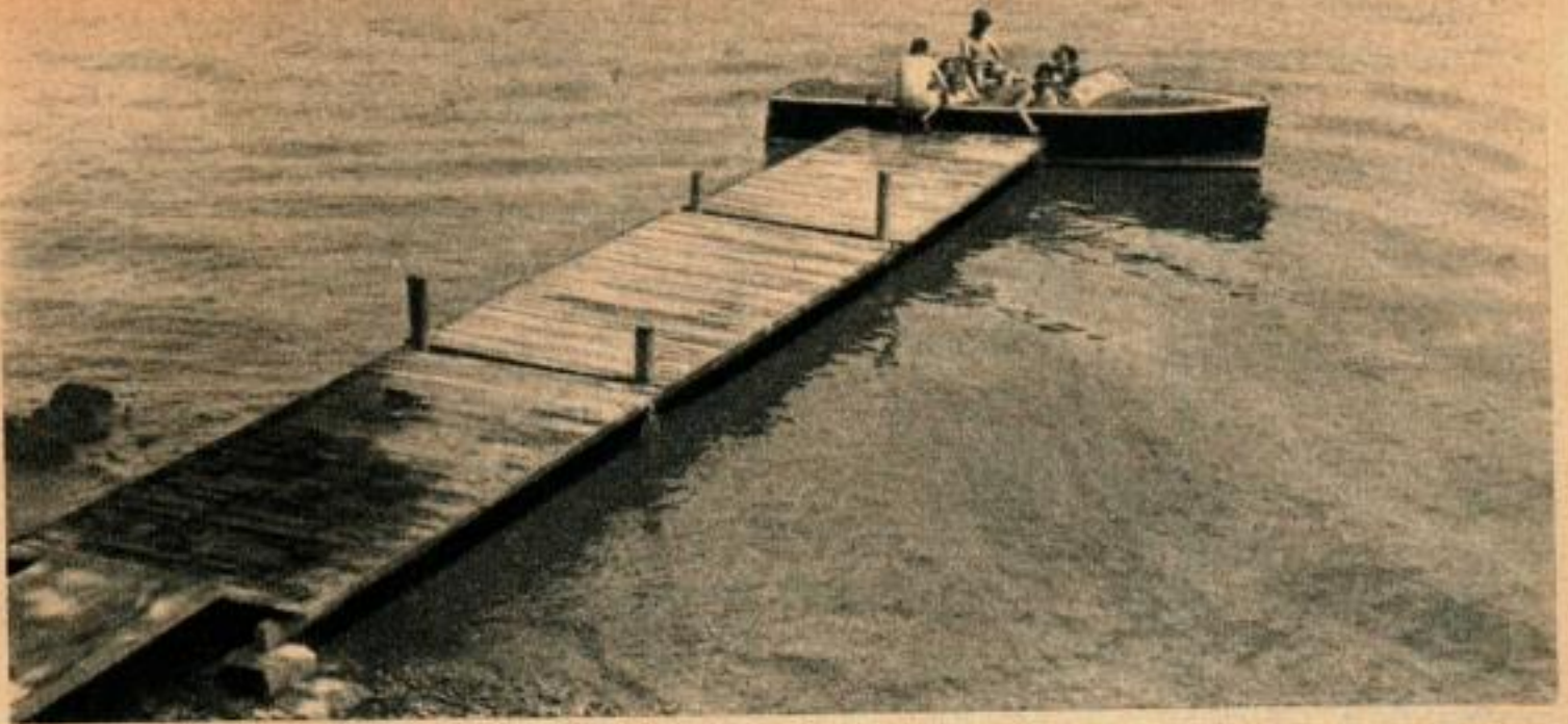
Une heure avant l'embarquement, les pièces constituant la jetée se trouvaient encore empilées dans un hangar à bateaux.