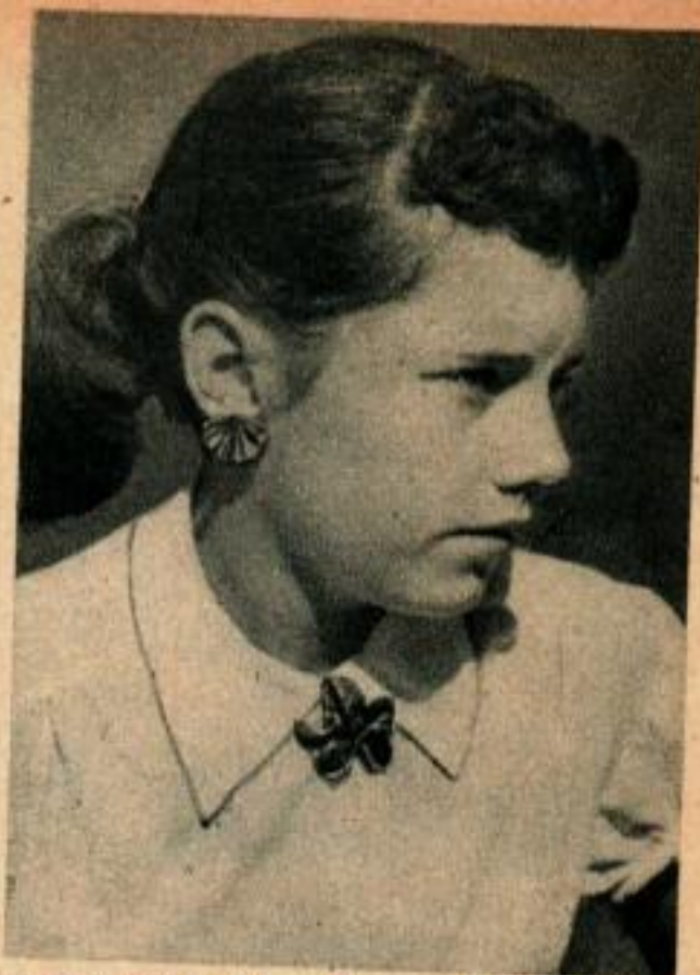
Cette jeune fille porte fièrement des boucles d'oreille et une broche fabriquées par son père à l'aide de feuilles d'arbre.