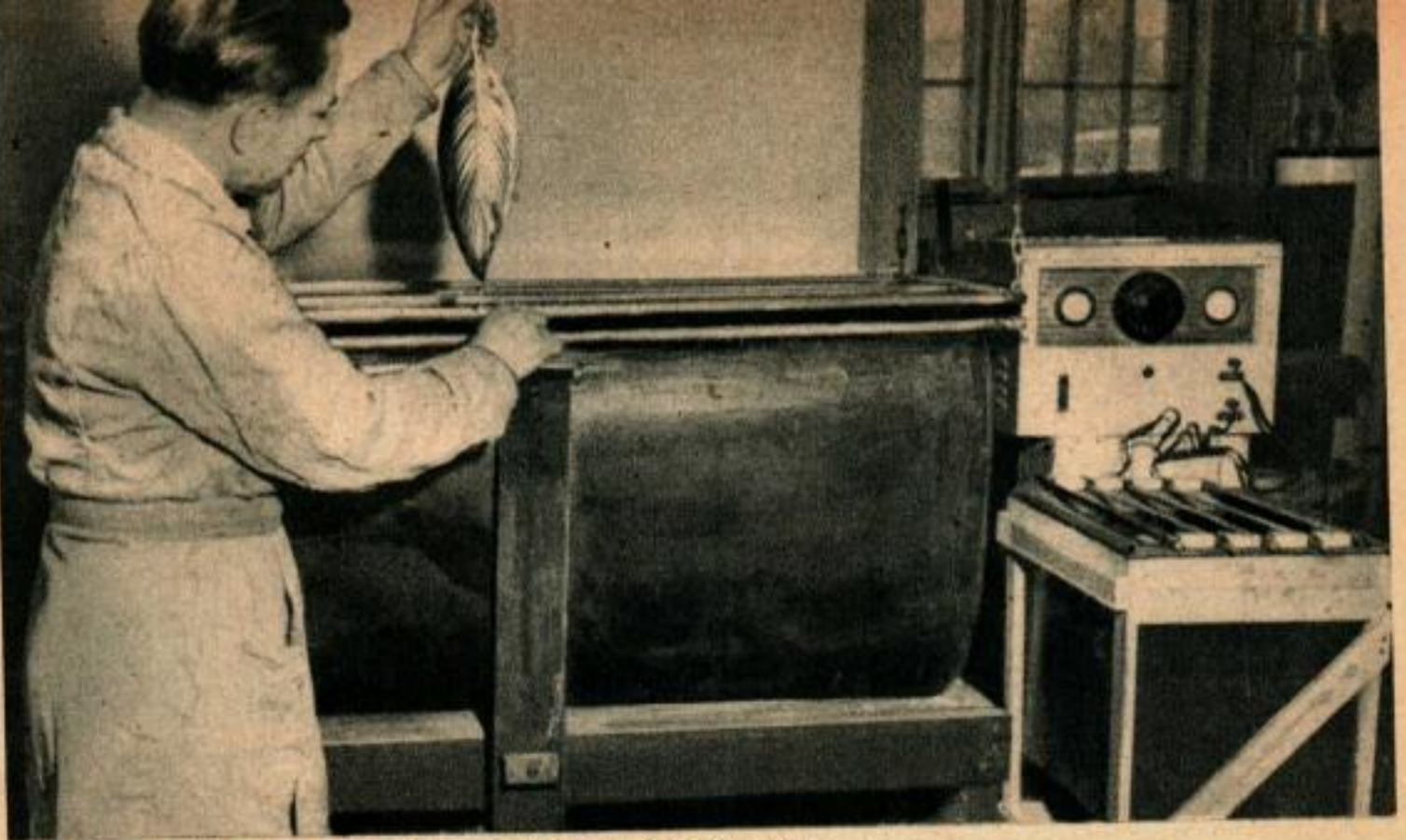
Le réservoir d'aile d'un avion des surplus de l'armée a été transformé en bac fixateur. Ici l'artiste examine une feuille pour voir si elle a été correctement plaquée.

Dans le petit recoin qu'il a aménagé pour y effectuer ses pulvérisations, il recouvre de cuivre un motif décoratif à tête de cheval. Ci-dessous, à droite, des chaussures d'enfant montées par lui dans un style unique.