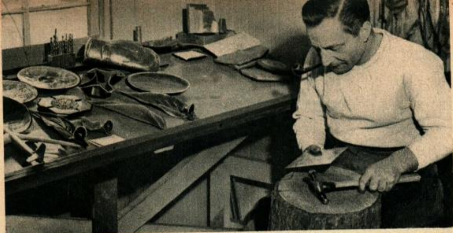
C'est également un artiste dans le travail du cuivre repoussé. Le métal qu'il tient en mains va être transformé en un cendrier étincelant.

C UEILLIR de l'argent sur des arbres, tel est le travail de cet artiste dont le métier est de plaquer des objets avec du cuivre. Il choisit des feuilles d'arbres et de buissons et les transforme en boucles d'oreille, chandeliers et autres objets d'art. La moindre petite nervure de la feuille est recouverte et reproduite dans son intégrité par une couche de cuivre brillant.