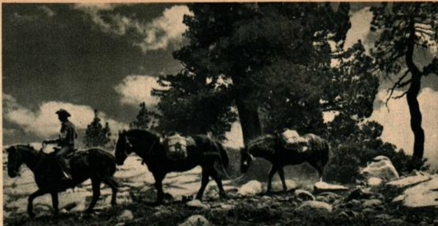
Autrefois les lacs de montagne ne pouvaient être repeuplés en fretin que par convois de mules sur des sentiers perdus.

Les petits lacs sont survolés en quelques secondes. La descente optimum qui tient compte des meilleures conditions de largage et de sécurité doit être étudiée à mesure que l'appareil franchit les pics et les murailles montagneuses, puis oblique en piqué vers ce petit « point bleu » là-bas.