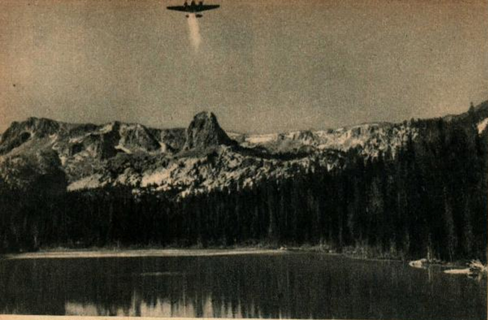
L'eau se transforme soudain en brouillard... et des milliers de petites truites plongent vers le lac.