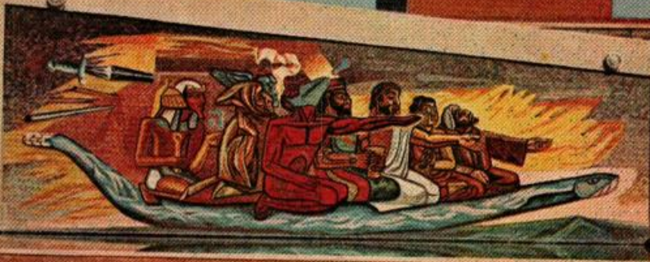
Un des pans d'un des bâtiments de section scientifique est entièrement occupé par une fresque représentant l'évolution de la Connaissance à travers les civilisations. Des bas-reliefs de l'artiste Diego Rivera, décorent les côtés du stade. Ils sont constitués par des milliers de cailloux colorés au moyen d'acides.