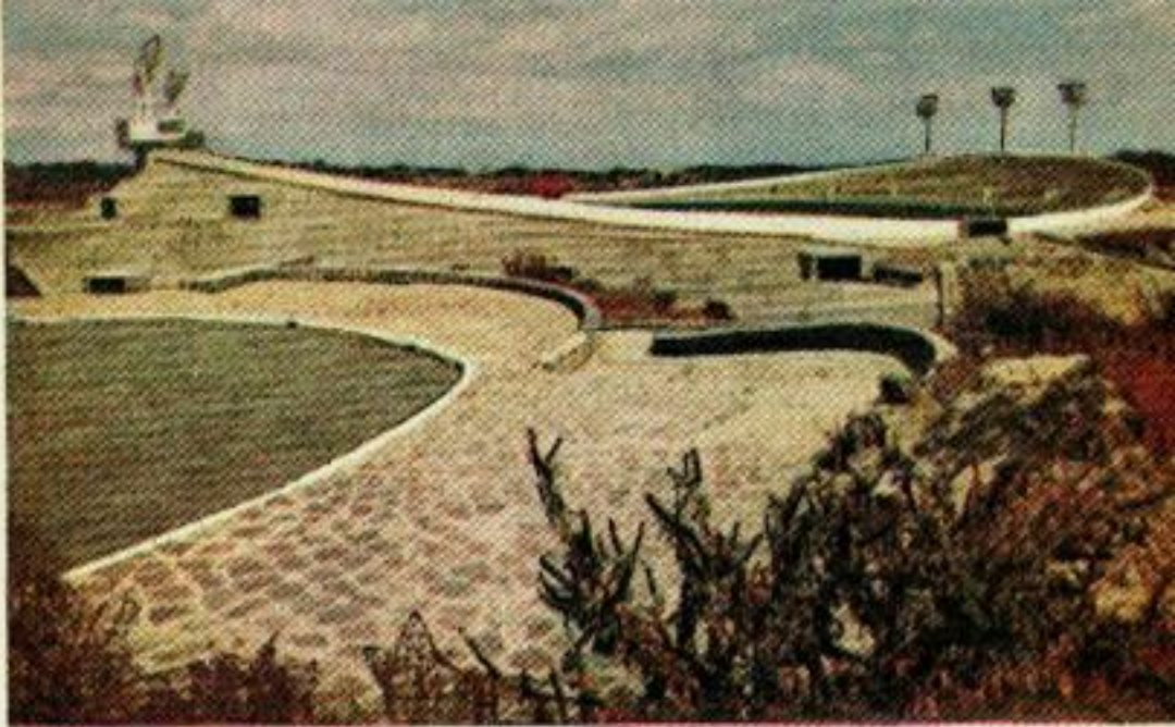
L'énorme Stade Olympique ressemble à un cratère de volcan. Les côtés qui bordent le milieu du champ sont surélevés, ce qui permet à un plus grand nombre de spectateurs de s'asseoir devant la ligne des « 50 mètres » (50 yd). Le nombre des places assises du stade est de 103 000.

Dans les plans du Stade, les architectes ont tenu compte du fait que la plu-