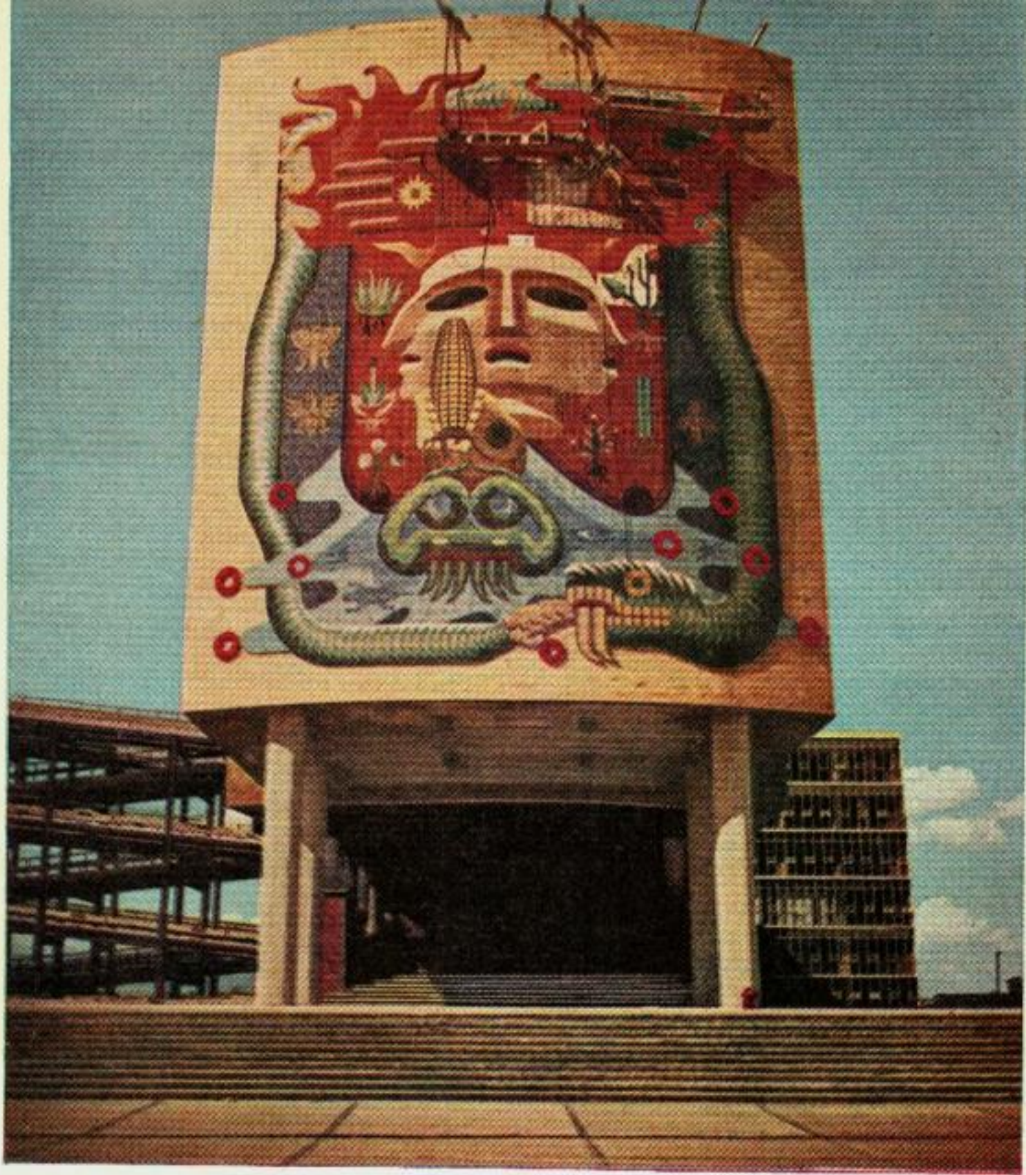
Des artistes utilisèrent des échafaudages pour travailler sur le bâtiment médical. Les mosaïques aztèques, faites en tuiles de verre, décrivent la vie et la mort.

reste de la « cité », car ici se trouvent, rutilants de couleurs, quelques-uns des plus extraordinaires bâtiments scolaires qui aient jamais accueilli un étudiant.